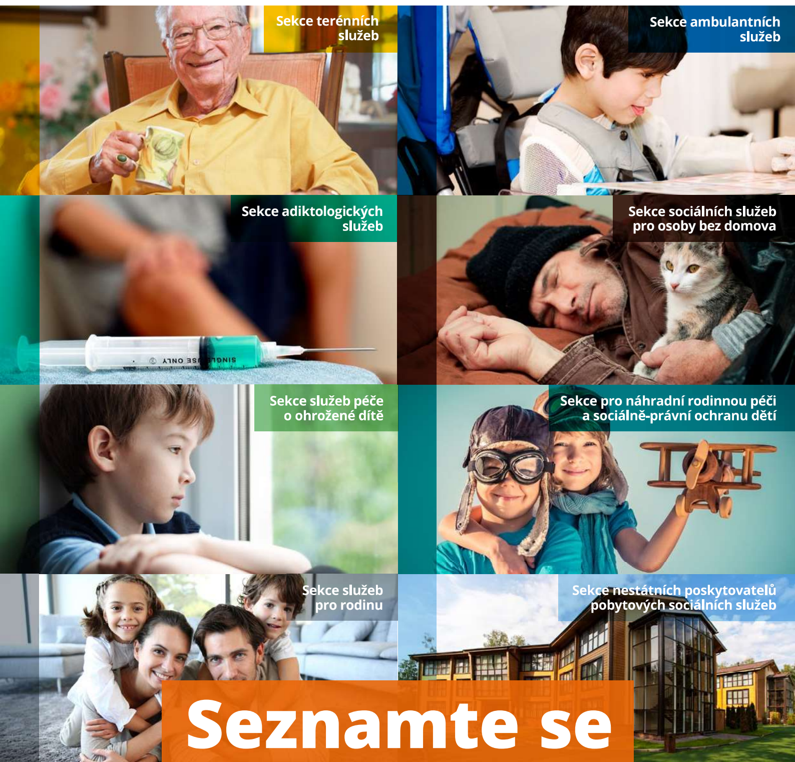
Sekce terénních služeb