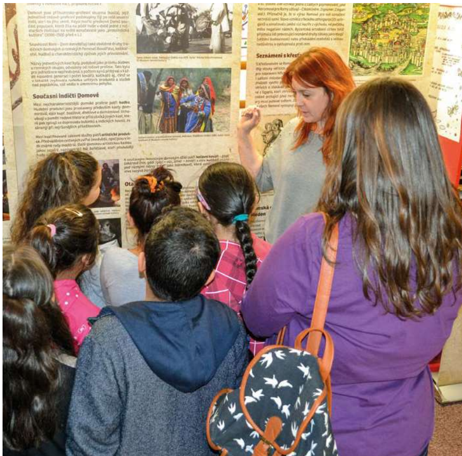
Archiv NZDM Archa Kutná Hora

Sociální služby, které sekce nově sdružuje, mají na našem území velmi rozsáhlou působnost. Jedná se celkem o více než pět set registrovaných služeb, které poskytují svoji podporu a pomoc tisícům klientů nacházejících se v nepříznivé sociální situaci. Především sociálně aktivizační služby pro rodiny s dětmi pracují s velmi širokou cílovou skupinou. Jedním z cílů sekce do následujícího období je nabídnout jednotlivým službám, aby se na stránkách časopisu Sociální služby mohly prezentovat a sdílely s ostatními příklady dobré praxe a svoje zkušenosti s konkrétní cílovou skupinou. V roce 2020 plánujeme také setkání sekce, které bude koncipováno formou pracovní skupiny. Pro pracovníky nízkoprahových zařízení pro děti a mládež existuje několik pracovních skupin, které se scházejí v rámci jednotlivých krajů. Tyto skupiny slouží jednak ke sdílení, ale také k organizování nejrůznějších společných aktivit nízkoprahových zařízení pro děti a mládež, které mají za úkol spojit pracovníky, ale také klienty různých služeb. Meziklubové turnaje, výlety nebo talentové soutěže jsou pak prostorem pro osobní rozvoj všech zúčastněných. Setkání sekce bude tedy příležitostí také pro pracovníky sociálně aktivizačních služeb, aby vytvořili pracovní skupinu, která bude fungovat na podobných principech.